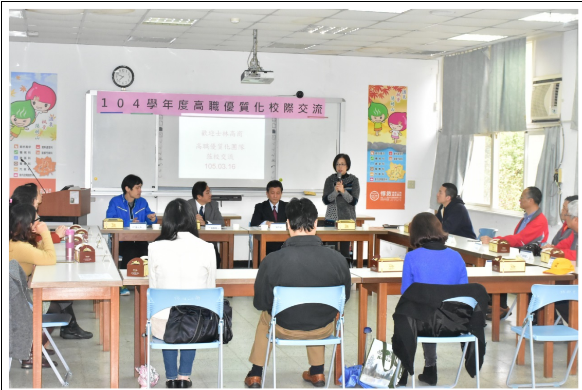
(百齡高中校長致詞)