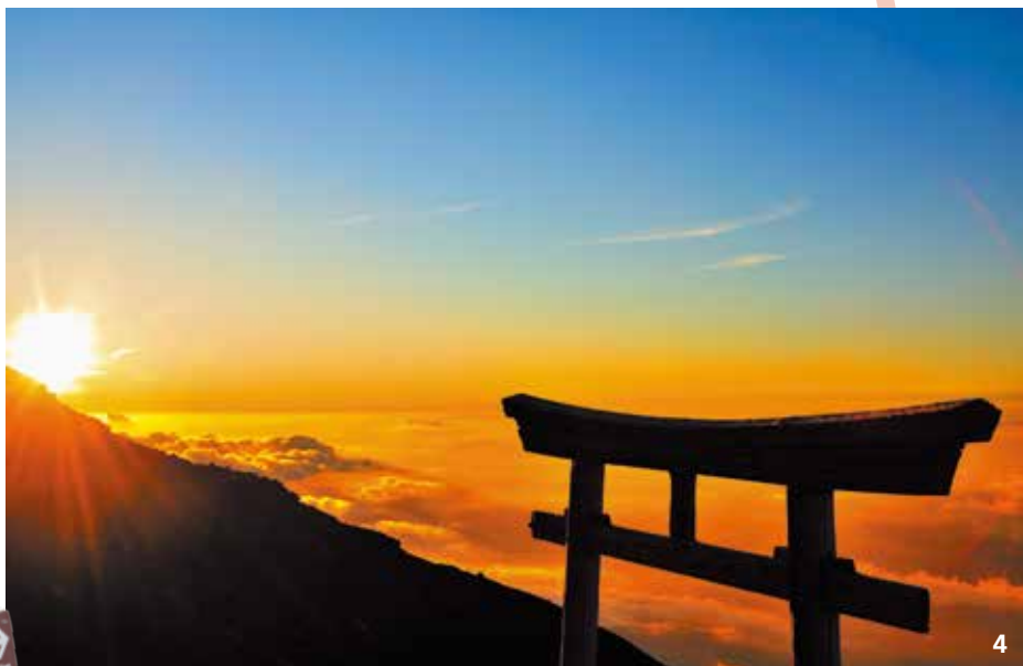
1、每到富士山登山季節，總是有來自日本各地與海外登山客前來一睹富士山風采。2、許多登山客都喜歡購買「金剛杖」當成登山手杖，每抵達一個合目，就印一個燒印在杖上當登山紀念。3、在山小屋裡遇見親切的日本大叔，還仔細地講解富士山的歷史給我們聽。4、攀登到富士山頂，看見「御來光」的那刻，心中感動無法用言語來形容。