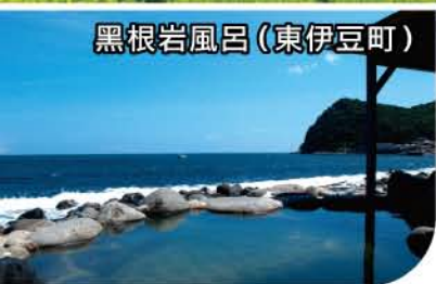
黑根岩風呂(東伊豆町)