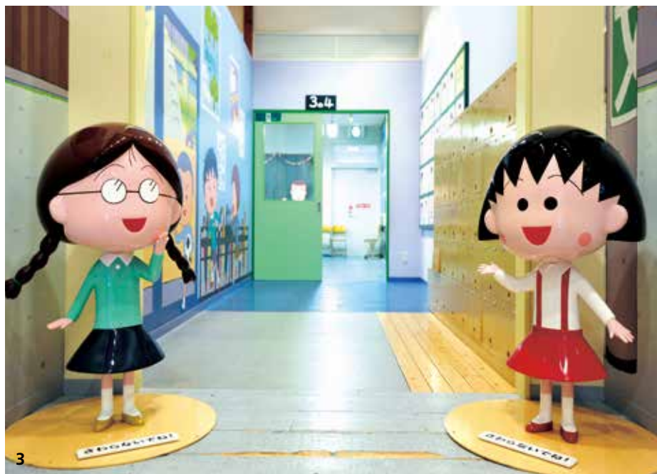
1、櫻桃小丸子樂園裡可以買到木製的小丸子造型明信片，還有小玉及爺爺的造型囉！2、放大到真人尺寸的小丸子的家，可看到小丸子(凌亂?)的房間，真是超可愛的。3、小丸子和小玉站在樂園門口，歡迎大家進去櫻桃小丸子的世界。4、是節耶！小丸子終於來到清水市看你囉！5、全日本最大的折扣商城御殿場Premium Outlets，可以清楚看到雄偉的富士山。6、靜岡縣有非常多遠洋漁船聚集的大港，可以吃到便宜又大碗的鮪魚海鮮丼。7、令人大呼過癮的「日本第一驚訝富士山丼」，只有在靜岡縣才吃得到！(只販售到8月18日)

櫻桃小丸子樂園裡將小丸子的家以真人大小版重現，可以看到小丸子和姐姐的房間、爺爺奶奶在和室裡喝茶、媽媽在廚房裡準備晚餐，此外還有小丸子的學校教室、小丸子與小玉一起玩耍的操場及翹翹板，樂園裡還準備了小丸子、小玉、花輪、美環的服裝，就連帽子、書包都一應俱全，讓大朋友與小朋友都可以打扮成卡通裡的角色，在各種場景前拍攝紀念照。除了有數不清的櫻桃小丸子相關商品可購買，只要在這裡寄出的明信片都可以蓋上櫻桃小丸子樂園限定的戳章，小丸子迷們可千萬別錯過囉！