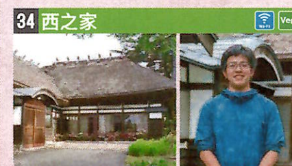
●住所 仙北市角館町小勝田下村34 ●定員 8人