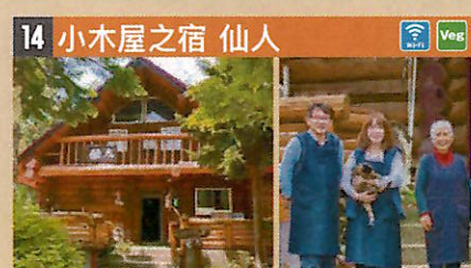
●住所 仙北市田澤湖生保内字下高野71-96 ●定員 10人