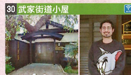
●住所 仙北市角館町川原町23-2 ●定員 7人