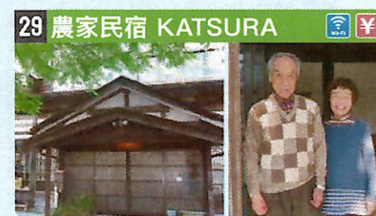
●住所 仙北市西木町門屋字六本杉21 ●定員 6人