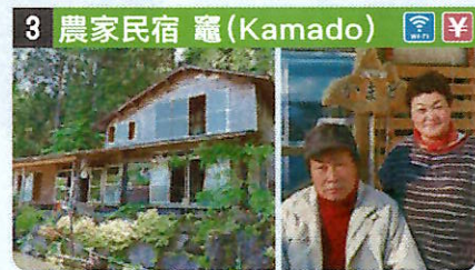
●住所 仙北市田澤湖生保内字黒澤138-1 ●定員 9人