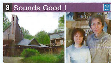
●住所 仙北市田澤湖田澤字湯前160-58 ●定員 13人