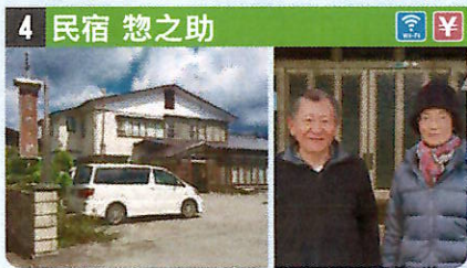
●住所 仙北市田澤湖生保内字阿氣128 ●定員 20人