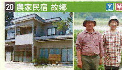
●住所 仙北市田澤湖神代字野中清水424 ●定員 5人