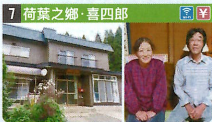
●住所 仙北市田澤湖田澤字打野69 ●定員 5人