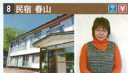
●住所 仙北市田澤湖田澤字春山3-1 ●定員 15人