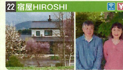
●住所 仙北市田澤湖角館東前郷六丁野9-1 ●定員 4人