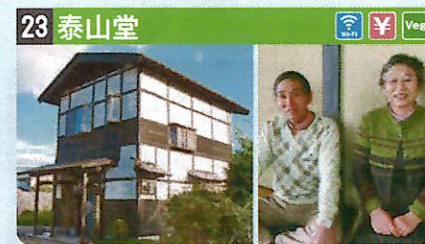
●住所 仙北市西木町小淵野字落合56 ●定員 5人