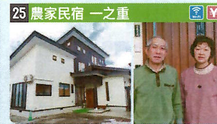
●住所 仙北市西木町小淵野字落合153 ●定員 5人