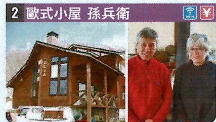
●住所 仙北市田澤湖生保内字上石神29-11 ●定員 16人