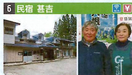
●住所 仙北市田澤湖生保内字石神107 ●定員 20人