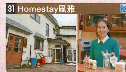
●住所 仙北市角館町小館34-8 ●定員 4人