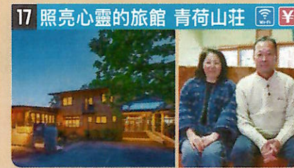
●住所 仙北市田澤湖生保内字下高野73-14 ●定員 30人