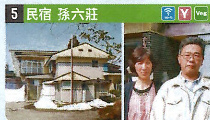
●住所 仙北市田澤湖生保内字山根36 ●定員 21人