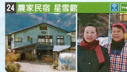
●住所 仙北市西木町檜木内字大台野開404 ●定員 7人