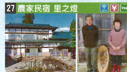
●住所 仙北市西木町小淵野字小淵野194 ●定員 5人