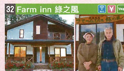
●住所 仙北市角館町西長野字川下田368 ●定員 10人