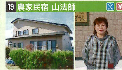
●住所 仙北市田澤湖卒田字早稻田106 ●定員 4人