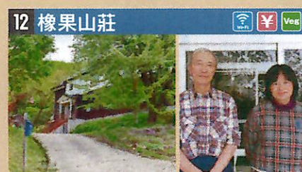
●住所 仙北市田澤湖生保内字下高野72-30 ●定員 16人