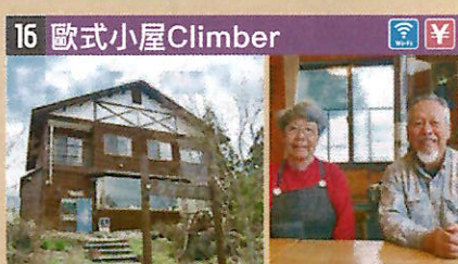
●住所 仙北市田澤湖生保内字下高野73-22 ●定員 12人