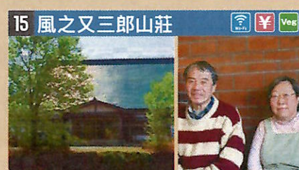
●住所 仙北市田澤湖生保内字下高野73-26 ●定員 15人