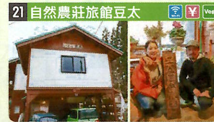
●住所 仙北市田澤湖卒田字黒倉262-3 ●定員 4人