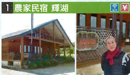
●住所 仙北市田澤湖湯字蛭兒堂90-2 ●定員 5人