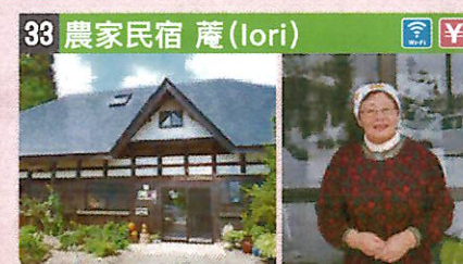
●住所 仙北市角館町小勝田前田65 ●定員 4人