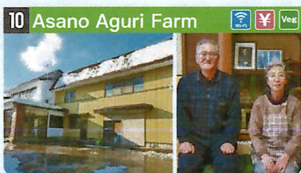
●住所 仙北市田澤湖生保内字宮之前24-3 ●定員 4人