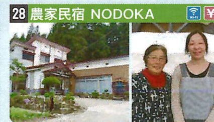
●住所 仙北市西木町上荒井字下橋元97-2 ●定員 5人