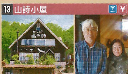
●住所 仙北市田澤湖生保内字下高野72-19 ●定員 10人