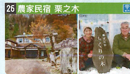
●住所 仙北市西木町小山田字鎌足186 ●定員 5人