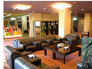
▲美人湯・菊池 GRAND HOTEL